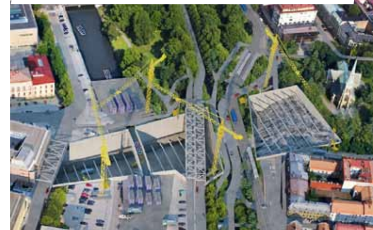
Montage av Rosenlundsområdet station Haga.